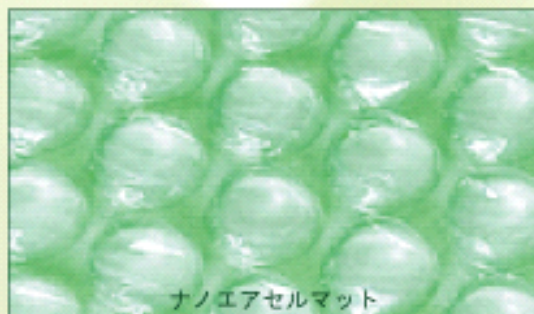
ナノエアセルマット